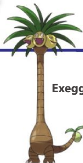
Exeggutor de Alola